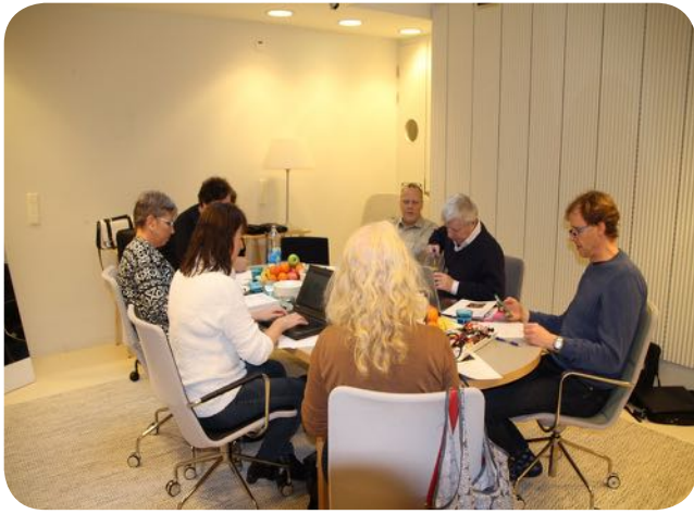
Styrelsearbetet i fullgång