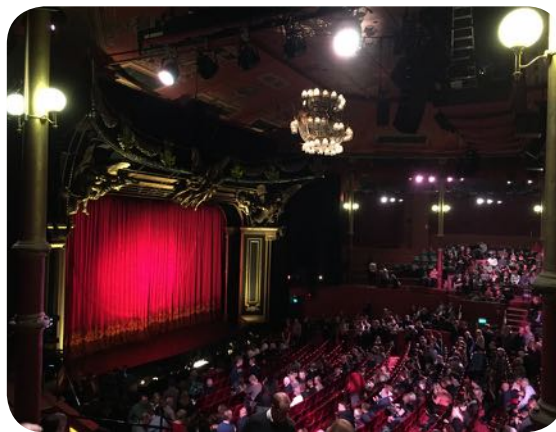
Kvällens föreställning, Phantom of the opera