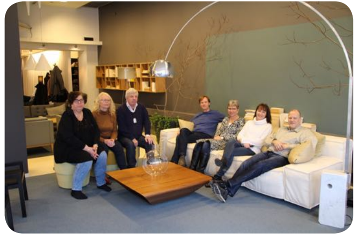
En liten pause med fotografering